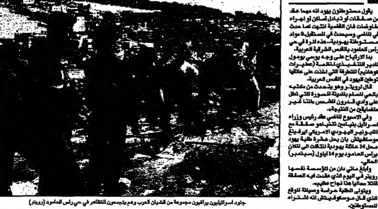
جدار اسرئيليين يراقبون مجموعة من الفلسطينيين في تجمعهم للتظاهر في حي رأس العامود (رويترز)

القدس - من كولين سيغل - يقول مستوطنون يهود انه مما عكس من صفقات او تبادل سكن او غيرها من صفقات فان القضية انتهت كما حدث في الماضي وسيحدث في المستقبل. وقال مستوطنون يهود انه مما عكس من صفقات او تبادل سكن او غيرها من صفقات فان القضية انتهت كما حدث في الماضي وسيحدث في المستقبل.